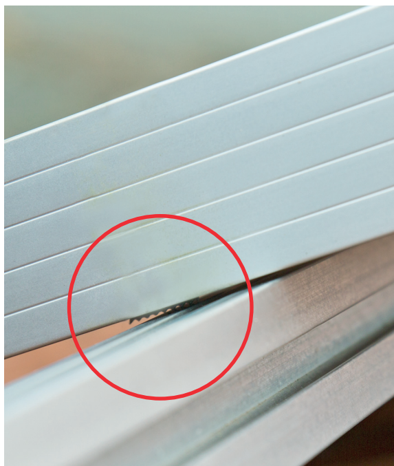
Modul auf Profilschiene legen