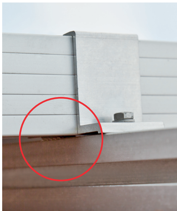
Mittel- bzw. Endklemme in Profil eingehängen und festziehen.